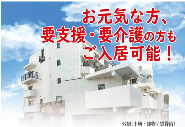
外観(土地・建物/賃貸借)